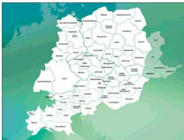
Mapa programového území OP CENTRAL EUROPE

Pro kvalitu projektových výstupů je důležitý princip nadnárodnosti, kdy musí být každý projekt realizován alespoň třemi projektovými partnery ze třech zemí. Dva z nich jsou poté vždy z programového území Střední Evropa, které našim partnerům umožňuje spolupráci se subjekty z Rakouska, Polska, některých regionů Německa, Maďarska, Slovinska, Slovenska, části Itálie, z nečlenských zemí a z části Ukrajiny.